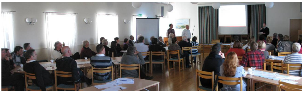
Ett femtiotal besökare hade samlats för att få veta mer och diskutera ICA Stormarknads utbyggnadsplaner på Hönö

Bland närvarande mötesdeltagare fanns även butiks innehavare från Hönö och Öckerö.