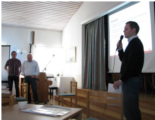
ICA presenterar sitt förslag